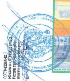
Схема безопасного подхода к МБУДО «ЦВР г. Челябинска» по адресу: 454112, г. Челябинск, ул. Пионерская, 11А

УТВЕРЖДЕНО М.П. МКУ «Управление государственного надзора в Челябинске» № 10/01-03/2017 2017 г.